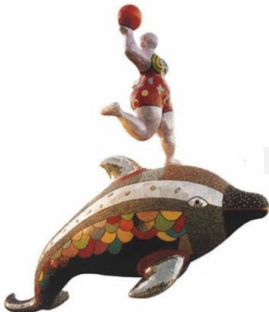
Niki de Saint Phalle - Nana on a dolphin (1998)