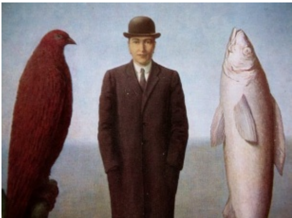
René Magritte - La présence d'esprit (1960)