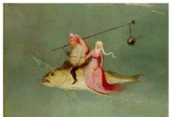
Jérôme Bosch - La tentation de saint Antoine (détail, v.1501)