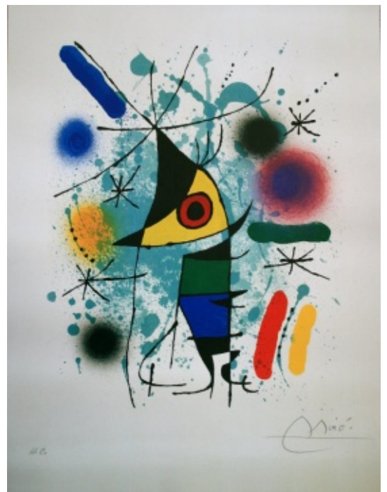
Joan Miró - Le poisson chantant (1972)