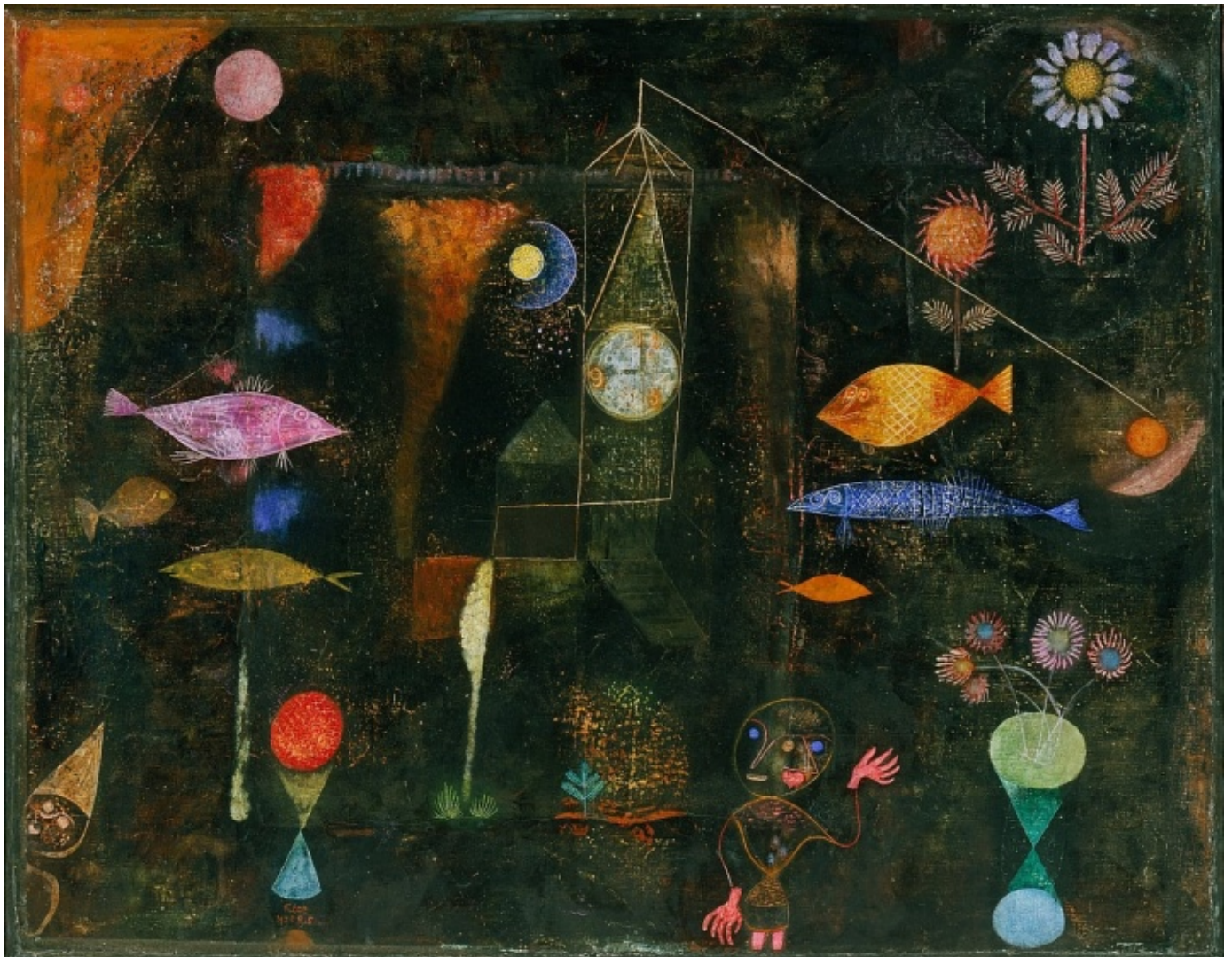
Paul Klee - Fish Magic (1925)

Respectivement installées à Bordeaux et à Nantes, les deux compagnies proposent une libre interprétation du tableau, vivante, fictionnelle et pluridisciplinaire . Elles jouent avec les codes du cirque et du monde forain : entresorts, automates, boîtes à musique. Paul Klee avait confectionné, de manière artisanale et avec les matériaux qui étaient à sa disposition, une cinquantaine de marionnettes pour son fils. C'est aussi dans cet esprit artisanal et « low-tech » qu'est abordée la création de ce spectacle. Un spectacle qui s'adresse autant aux enfants que nous étions qu'aux enfants d'aujourd'hui : à celles et ceux qui ont le monde à portée de mains et bientôt, le monde entre leurs mains.